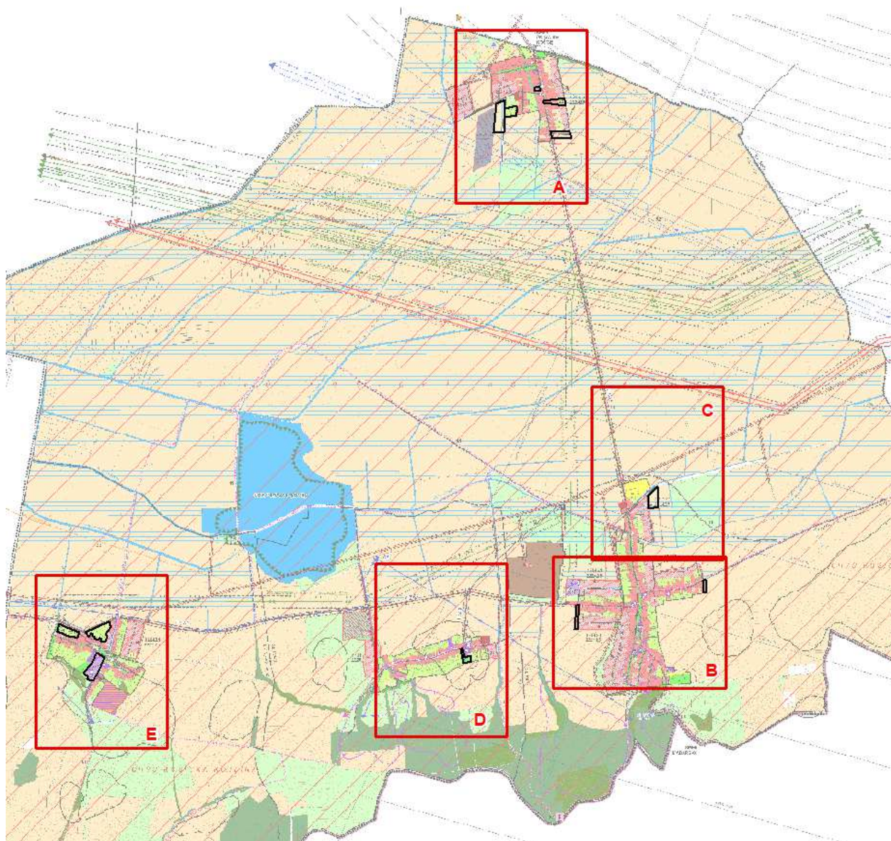
Schéma náložiek ZaD č.2