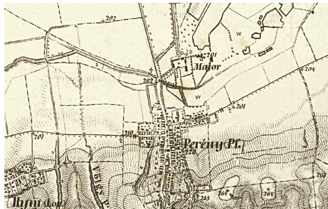
Obr.: Perín s majerom na vojenskej mape z konca 19. storočia