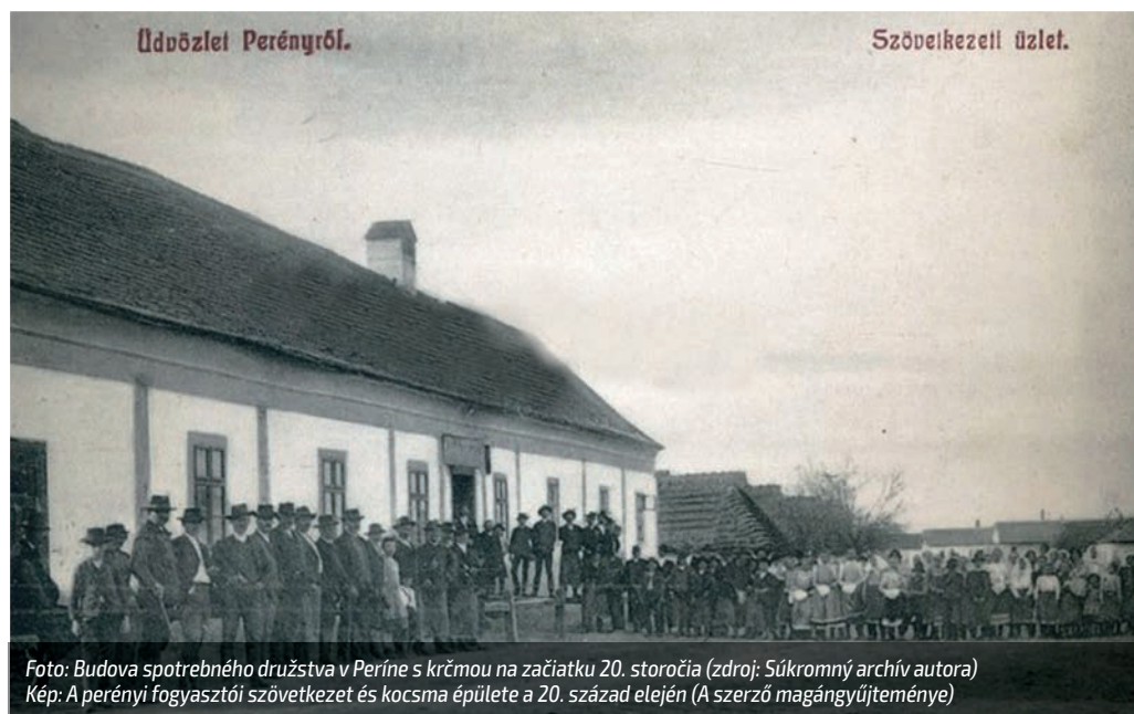
Foto: Budova spotrebného družstva v Períne s krčmou na začiatku 20. storočia Kép: A perényi fogyasztói szövetkezet és kocsmá épülete a 20. század elején